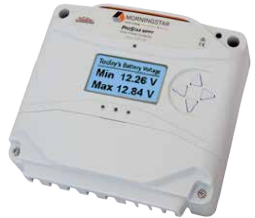
25- oder 40-Ampere-Ausführung, bis zu 120V Leerlaufspannung (Uoc), im Bild mit optionalem Messgerät

Dieser Regler erlaubt den Betrieb mehrerer Module in Reihe für 12 V- und 24 V-Akkusysteme. Detaillierte Akku-Programmierungsoptionen ermöglichen eine verbesserte Unterstützung für die neuesten Lithium-, Nickel-Cadmium- und Bleiakkus.