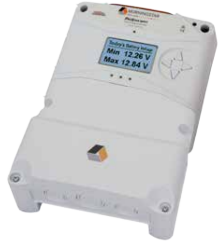
Abbildung mit optionalem Messgerät und Kabelbox